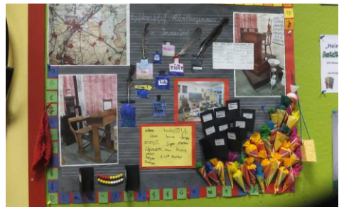
Kollage von Schülern der KGS Immendorf für einen Wettbewerb „Mein Lieblingsort“