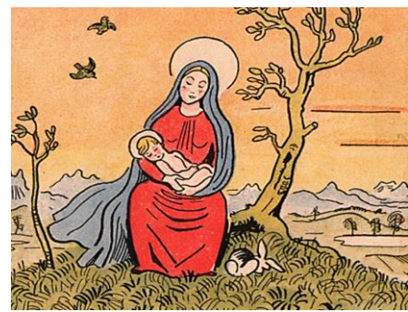
Fibel- Bild 1923 Maria mit dem Kind